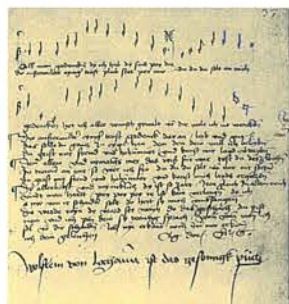
Lochamer Liederbuch, S. 37