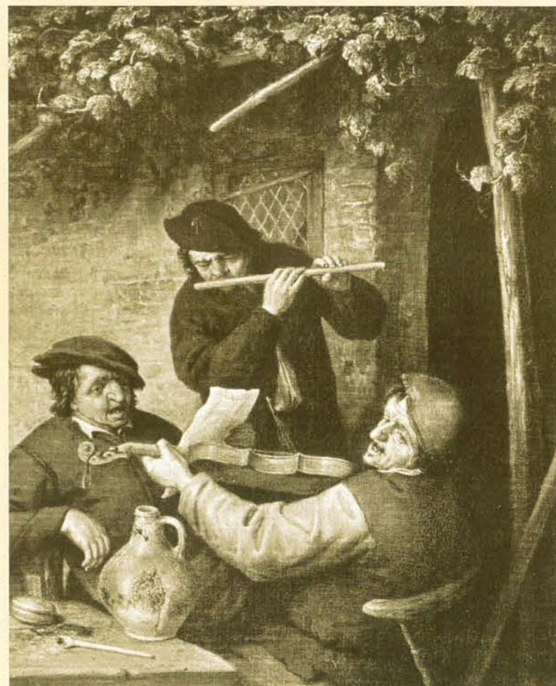
Adriaen van Ostade, Das flämische Trio

Herausgeber: Stiftung Kloster Michaelstein – Musikinstitut für Aufführungspraxis Redaktion: Monika Lustig, Ute Omonsky, Bert Siegmund Layout: nach Ameling + Witschaß Druck: Quedlinburg DRUCK GmbH