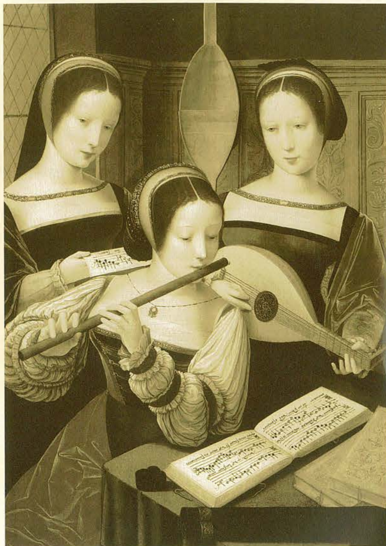
Unbekannter Meister aus den südl. Niederlanden, Drei musizierende Damen, um 1520/25