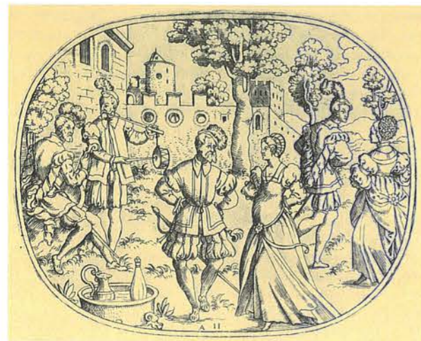
Galliarde im Freien, 1. Hälfte des 16. Jahrhunderts

anschließend: TREFFEN der Konferenzteilnehmer im Klosterrestaurant „Cellarius“