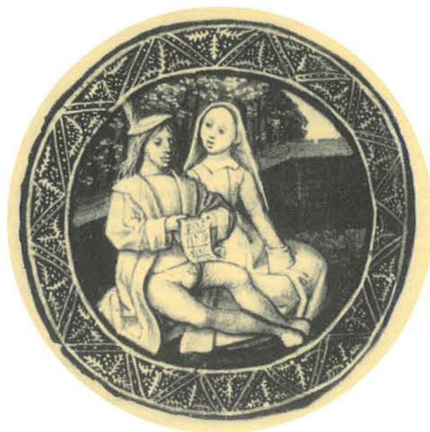
Singendes Paar, Textillustration aus dem 15. Jahrhundert

schools of instrument building, and period and personal styles. The characteristics of Saxon instrument making around 1600 – ascertained by extensive investigations and uniquely documented by the music instruments in the Freiberg Cathedral – will be placed in a larger European context and compared to other contemporary national schools of instrument building. Yet, it is not just a matter of seeking analogue traditions in centers of instrument making, such as Füssen, Nuremberg, Vienna, Lyon, Antwerp, Brescia, or Cremona, for example, but in addition also bringing out the influences of other regions on instrument making in the environs of Freiberg. Likewise to be investigated in this context should also be important questions concerning the effects of the component-producing and related trades on the school-forming constructional characteristics, and also concerning sixteenth-century music instrument commerce in connection, among other things, with migrational processes among musicians.