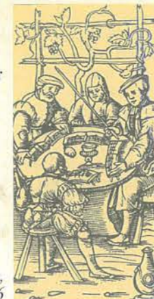
Singende Scholaren, Holzschnitt, Nürnberg 1516