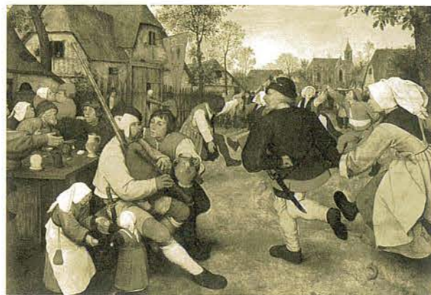
Pieter Bruegel d. Ä., Bauerntanz , um 1568