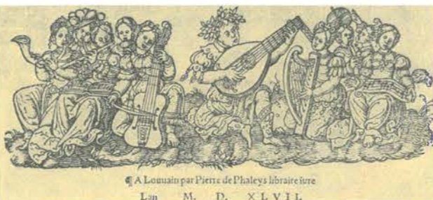
Titelvignette aus einem Tabulaturbuch des Verlegers Pierre Phalèse 1547